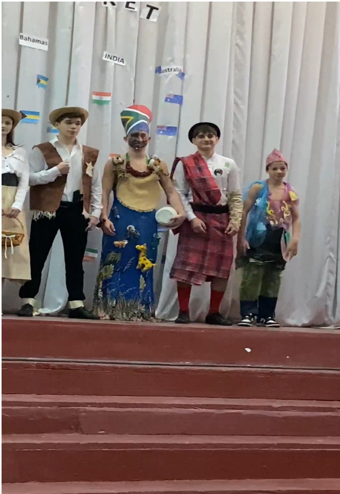
3. Prezentarea tradițiilor caracteristice cântec, dans etc.