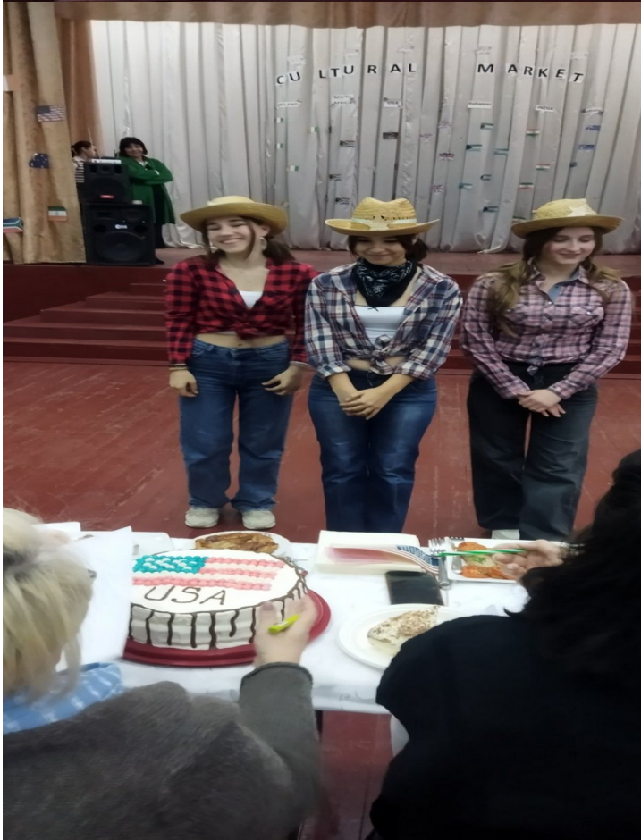
4. Prezentarea bucătăriei tradiționale.